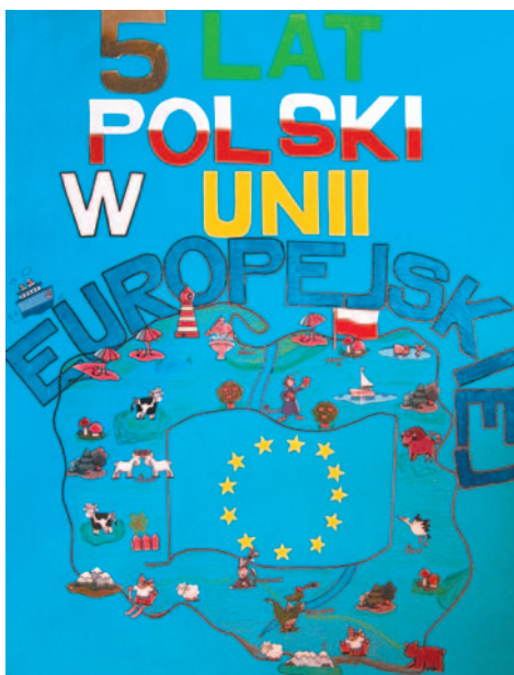
Paulina Spadek, Brzeszcze – nagroda