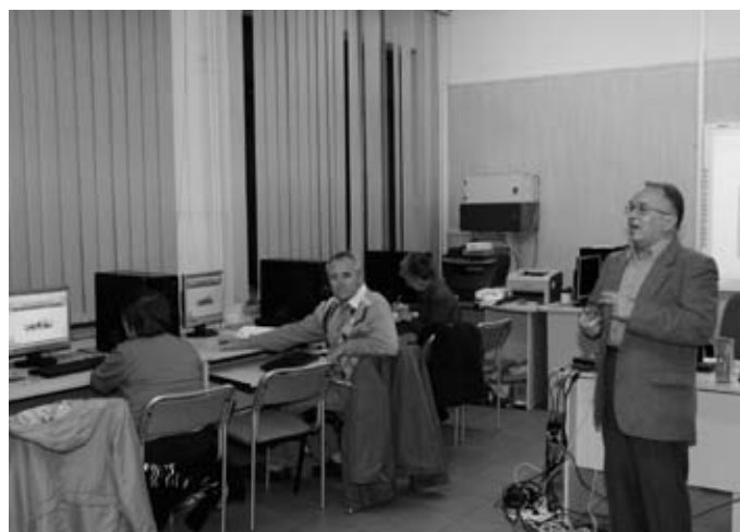
Kurs komputerowy w Gimnazjum nr 1 w Brzeczczach