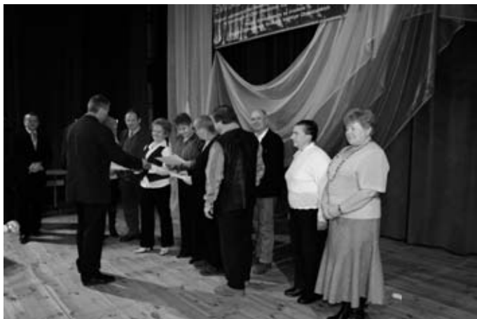
W trakcie konferencji wręczono certyfikaty ukończenia kursów

Zmierzamy do końca programu, przedstawione cyfry mogą świadczyć o tym, że program został zrealizowany. Jednak nie cyfry świadczą o ocenie jego realizacji. Najważniejszą oceną dla organizatorów i prowadzących zajęcia jest ocena uczestników projektu: uczniów, seniorów i mieszkańców naszej gminy. Przy pisaniu programu Zarząd kierował się łańciską maksymą „Pro publico bono”, czyli dla dobra ogółu. Mamy nadzieję, że nasz program został w ten sposób odebrany. Realizacja programu „Świadomy Konsument” dobiega końca. Wierzymy, że nie jest to ostatni program realizowany przez Stowarzyszenie.