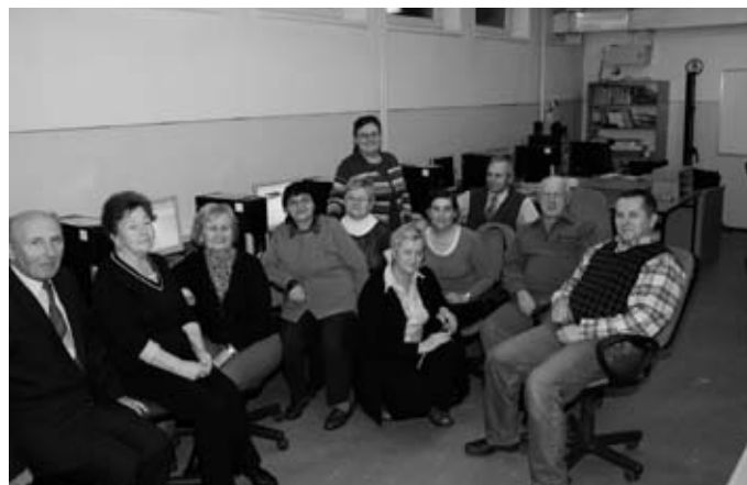
Uczestnicy kursu komputerowego w Zespole Szkół Powiatowych nr 7 w Jawiszowicach