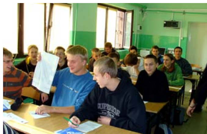
Lekcja w Zespole Szkół Powiatowych nr 7 w Jawiszowicach

Nauczyciele i dyrektorzy szkół podkreślali, że zajęcia były bardzo przydatne. W gimnazjach poszerzyły ofertę edukacyjną realizowaną na zajęciach z przedsiębiorczości o dodatkowe informacje i umiejętności. Ze szczególnym zainteresowaniem wśród młodzieży szkół ponadgimnazjalnych – co nie dziwi – spotkał się temat sprzedaży na odległość (zakupy internetowe). Uzbrojeni w wiedzę z zakresu praw konsumenckich uczniowie, powinni ustrzec się przed nieudanymi zakupami.