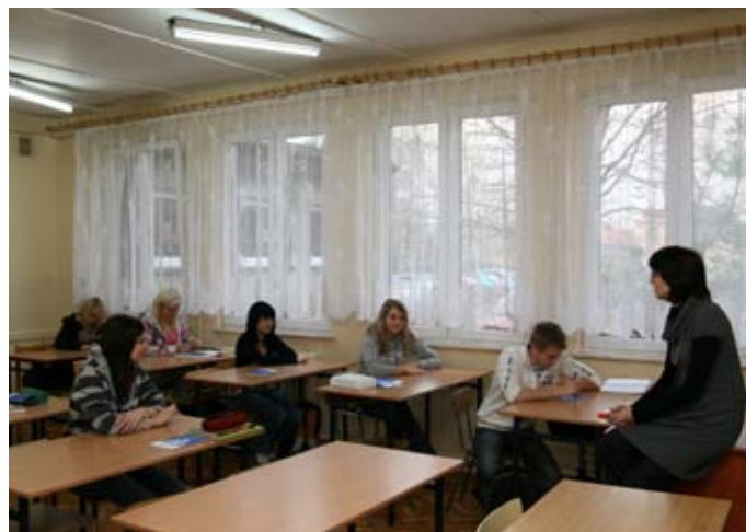
c.d. na str. 4

W czterech szkołach – Gimnazjum nr 1, Gimnazjum nr 2, Powiatowym Zespole nr 6 Szkół Zawodowych i Ogólnokształcących w Brzeszczach oraz Powiatowym Zespole nr 7 Szkół Agrotechnicznych i Zawodowych w Jawiszowicach od września odbywały się zajęcia w ramach programu „Świadomy Konsument”. Uczniowie przez trzy kolejne miesiące poznali m.in. prawa konsumentów, placówki i instytucje zajmujące się ochroną praw konsumentów, sposoby reklamacji wadliwego towaru czy zagadnienia związane z reklamą i promocją. Mówili też o zagadnieniach sprzedaży na odległość i poza lokalem przedsiębiorstwa (Internet) oraz ochrony danych osobowych. W sumie w czterech szkołach w zajęciach wzięło udział