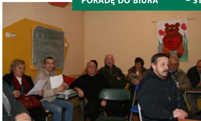
Spotkanie organizacyjne na os. Paderewskiego

Stowarzyszenie Rozwoju Gospodarności Finansowej w Brzeszczach powstało w 1998 r. W początkowym okresie prowadziło działalność wydawniczą i szkoleniową. Ważnym momentem w historii Stowarzyszenia było nawiązanie współpracy z Federacją Konsumentów. Współpraca z Federacją Konsumentów zapoczątkowana w 2007 r. obejmowała zorganizowanie wykładu w ramach Uniwersytetu Trzeciego Wieku oraz spotkania konsultacyjnego w ramach „Dnia Konsumenta”. Podczas spotkania, które odbyło się w Domu Kultury, omawiano podstawowe prawa przysługujące konsumentom. Spotkanie prowadziła prezes Fe-