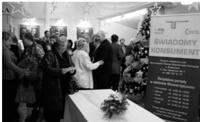
Program zakończyła konferencja w Domu Kultury w Brzeszczach