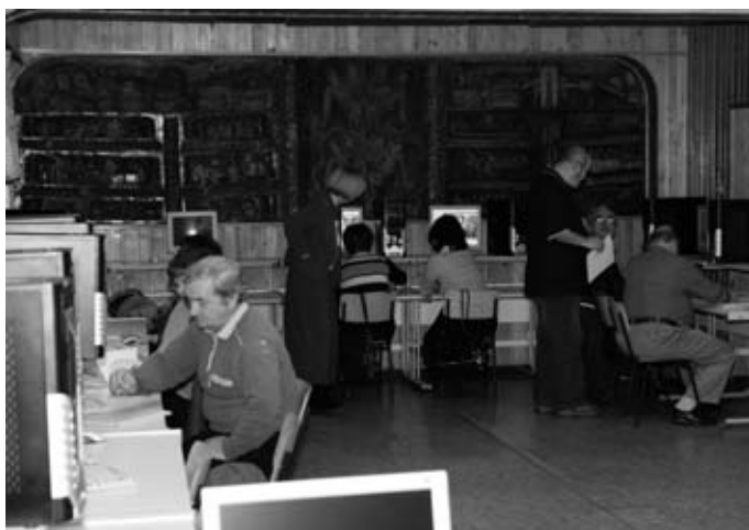
Kurs komputerowy w Zespole Szkół Powiatowych nr 6 w Brzeczczach

Program „Świadomy Konsument” stanowił prawdziwe wyzwanie organizacyjne i merytoryczne dla Zarządu. Stowarzyszenie włożyło dużo wysiłku w realizację programu, a największą satysfakcją i nagrodą dla organizatorów było zadowolenie i bardzo pochlebne opinie uczestników, którzy wręcz domagali się kontynuacji programu w 2010 r.